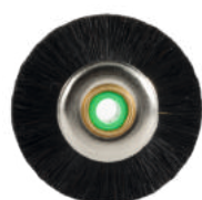
Для металла Ø 4,5