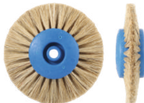
Для акриловых пластмасс Ø 7,5