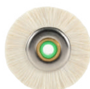
Для акриловых пластмасс из козьего ворса Ø 4,5