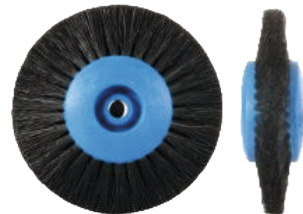
Для металла Ø 7,5