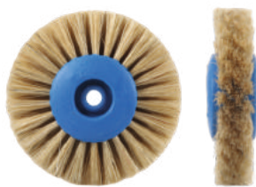
Для акриловых пластмасс Ø 7,5