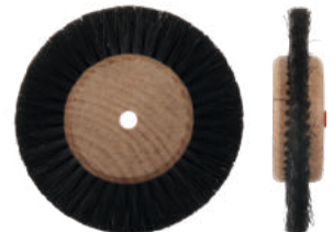
Для металла Ø 7,5