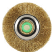
Для металла из металлической проволоки Ø 4,5