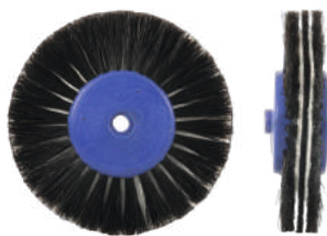
Для металла Ø 7,5