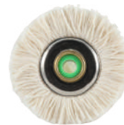
Универсальная для зеркальной полировки Ø 4,5