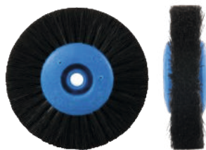
Для металла Ø 7,5