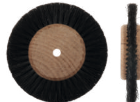
Для металла Ø 7,5