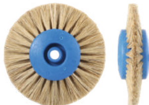
Для акриловых пластмасс Ø 7,5